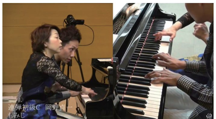
▲PTNA YouTubeライブ配信画面より

会社の会議もどんどんネットになっていっています。顔を合わせて話すことはもちろん大切なのですが、距離と制約を超える便利なツールを使うというのは決して悪いことではないはず。こういうところはどんどん積極的に取り組んでいくのもいいかもしれませんね！