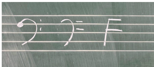
▲Fの形から変形してきたらしいです（ちょっと強引？）

ト音記号に比べると独自の書き方をする人が少ないイメージのあるヘ音記号。成り立ち自体はちょっと強引な気もしないでもないですが（笑）、ルールは覚えておいてくださいね